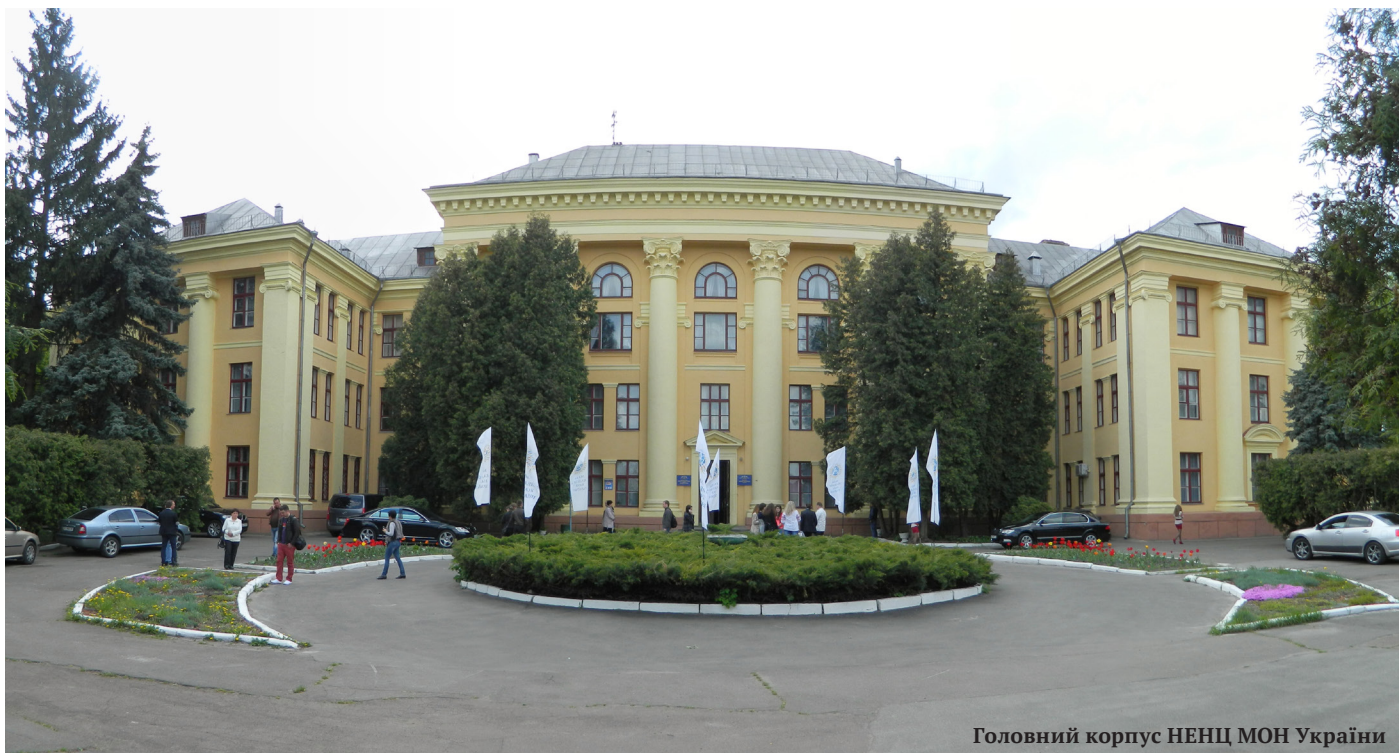
Головний корпус НЕНЦ МОН України

У структурі Національного еколого-натуралістичного центру понад 75 років функціонує Всеукраїнський профільний табір оздоровлення та відпочинку «Юннат». Табір має всі умови для освіти, відпочинку й оздоровлення дітей: Щороку на базі табору проходить зимове і літнє оздоровлення учнів (понад 1400 осіб), в рамках якого проводиться Всеукраїнська школа передового досвіду. З метою формування громадянської позиції в галузі збереження довкілля щорічно на базі табору проводиться збір лідерів Всеукраїнської дитячої спілки «Дитячий екологічний парламент» та юннатівських секцій охорони природи, Всеукраїнська літня Стартап Школа «StartChemist» тощо.