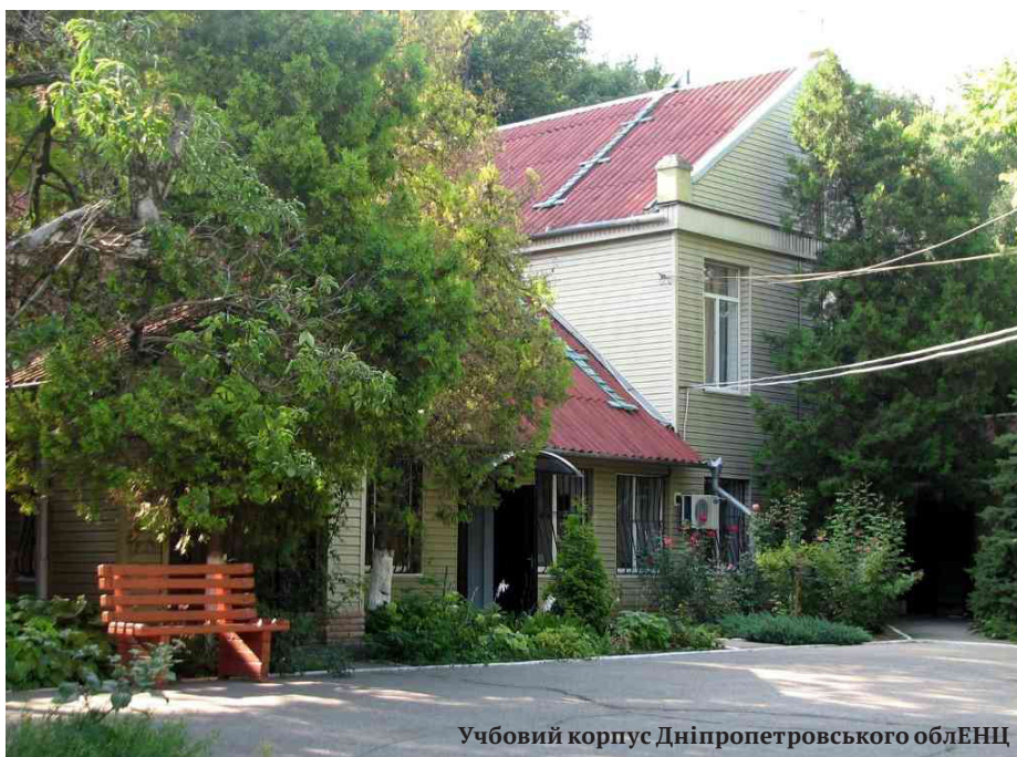
Учбовий корпус Дніпропетровського облЕНЦ

ських лісництв загально-освітніх та позашкільних закладів освіти. Щорічним підсумком роботи аграрних учнівських об'єднань, що поєднує компоненти профорієнтації, технологічної підготовки, дослідницької діяльності є Всеукраїнський зліт учнівських виробничих бригад, трудових аграрних об'єднань закладів загальної середньої та позашкільної освіти.